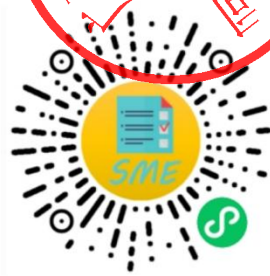
中小企业规模类型自测小程序

申明：测试结果是依据测试者提供的所属行业和有关指标数据生成，其信息真实性由测试者负责。