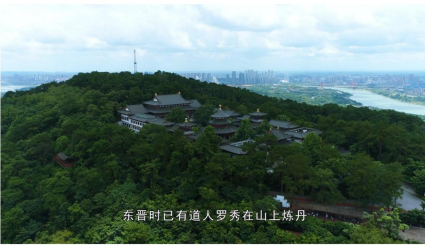
东晋时已有道人罗秀在山上炼丹