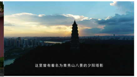
这里曾有着名为青秀山八景的夕阳塔影