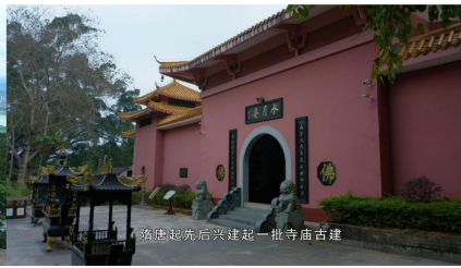
隋唐起先后兴建起一批寺庙古建