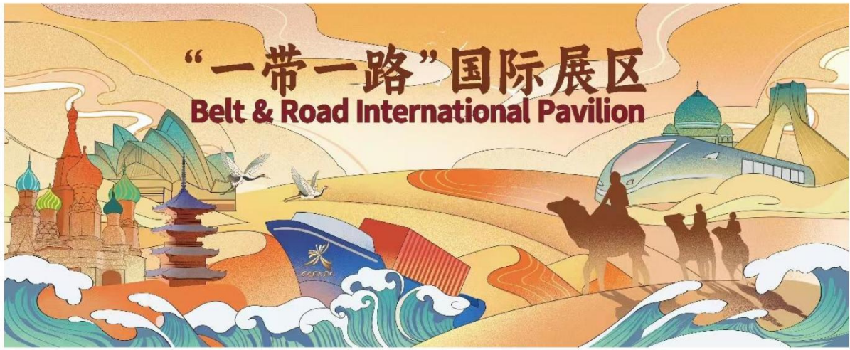
图为我司为2023年东博博览会一带一路国际展区进行主KV设计