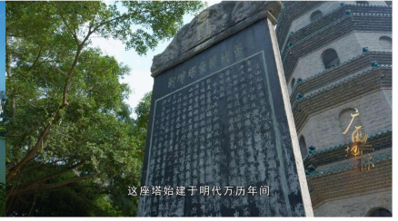
青秀山风景区位于南宁市东南邕江之畔