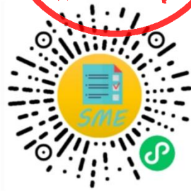
中小企业规模类型自测小程序

申明：测试结果是依据测试者提供的所属行业和有关指标数据生成，其信息真实性由测试者负责。