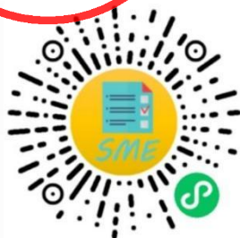
中小企业规模类型自测小程序

申明：测试结果是依据测试者提供的所属行业和有关指标数据生成，其信息真实性由测试者负责。