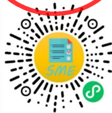
中小企业规模类型自测小程序

申明：测试结果是依据测试者提供的所属行业和有关指标数据生成，其信息真实性由测试者负责。