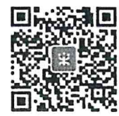
政采云平台微信公众号