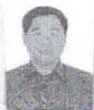
(加盖批准机关制印有效) Valid with embossed seal