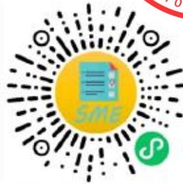
中小企业规模类型自测小程序

申明：测试结果是依据测试者提供的所属行业和有关指标数据生成，其信息真实性由测试者负责。