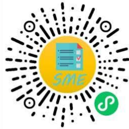
中小企业规模类型自测小程序

申明：测试结果是依据测试者提供的所属行业和有关指标数据生成，其信息真实性由测试者负责。