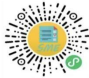
中小企业规模类型自测小程序

申明：测试结果是依据测试者提供的所属行业和有关指标数据生成，其信息真实性由测试者负责。