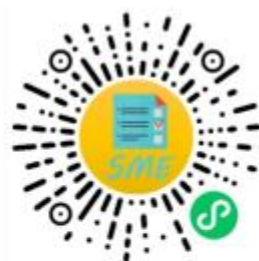
中小企业规模类型自测小程序

申明：测试结果是依据测试者提供的所属行业和有关指标数据生成，其信息真实性由测试者负责。