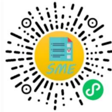
中小企业规模类型自测小程序

申明：测试结果是依据测试者提供的所属行业和有关指标数据生成，其信息真实性由测试者负责。