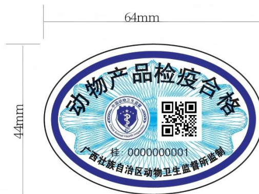
粘贴式检疫验证标志样式（正面）

配合采购人设置粘贴式检疫验证标志上的二维码，扫检疫验证标志上的二维码可链接到广西动物检疫证章标志管理信息系统，并可查询到该枚标志的号码及其订购、发放等相关信息。