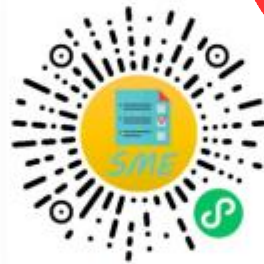
中小企业规模类型自测小程序

申明：测试结果是依据测试者提供的所属行业和有关指标数据生成，其信息真实性由测试者负责。