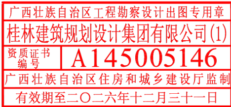
单位出图专用章(未盖出图专用章无效)