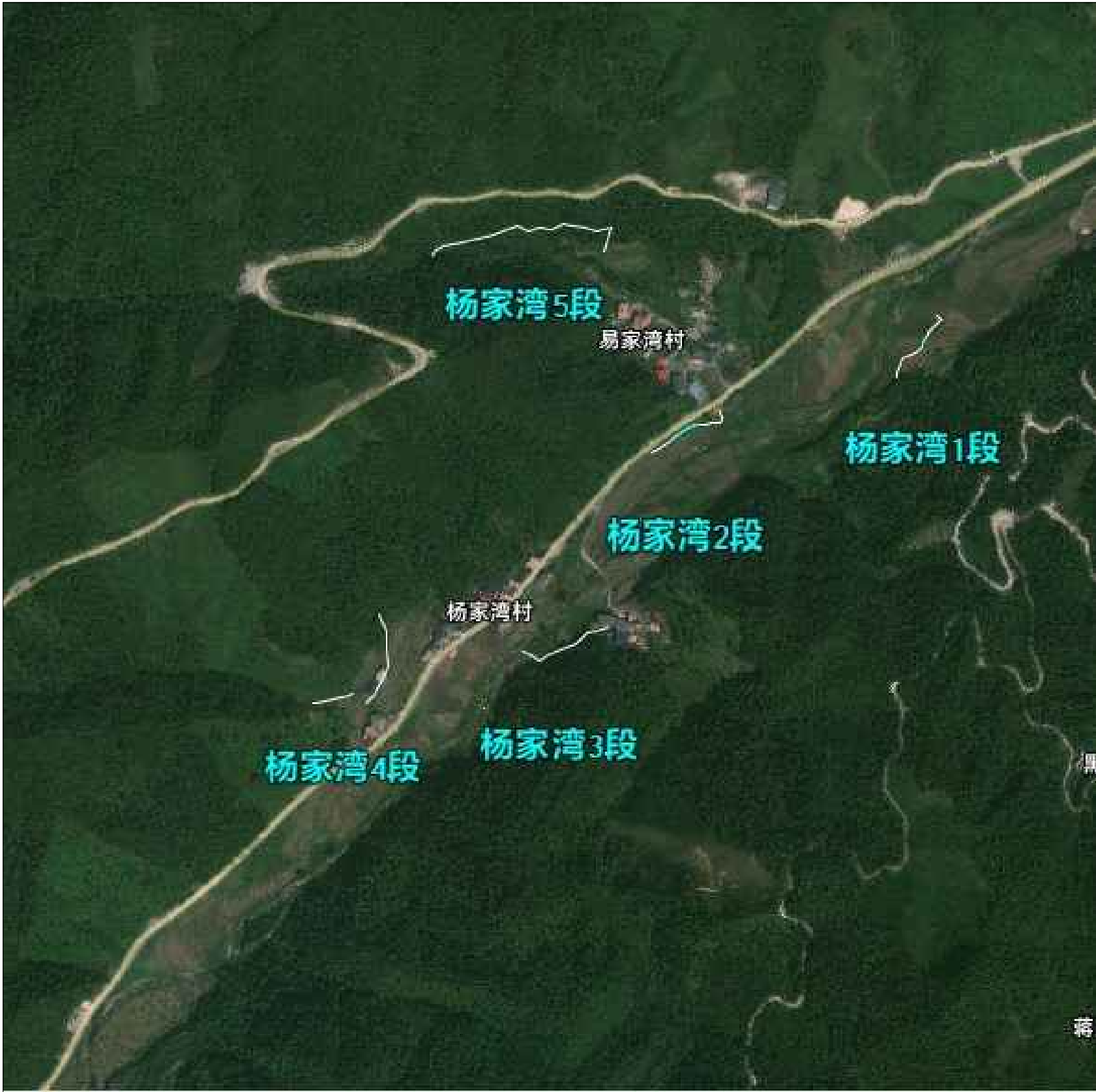
杨家湾水渠平面布置图