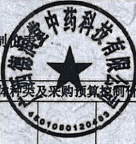
附件 1：具体种类及采购预算控制