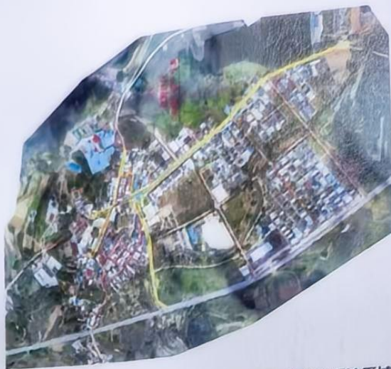
良圻社区：保洁面积：58481.35㎡，黄色框定部分为核心保洁区域。