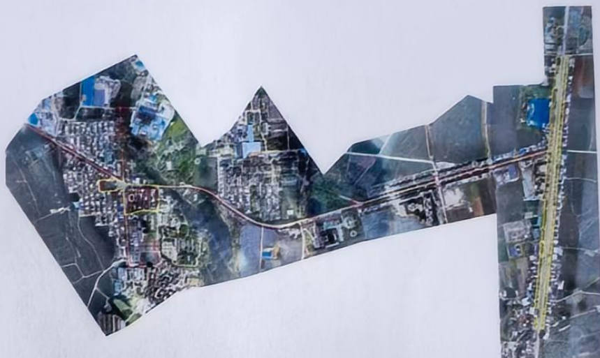
芳香社区：保洁面积：59929.76㎡，黄色框定部分为核心保洁区域。