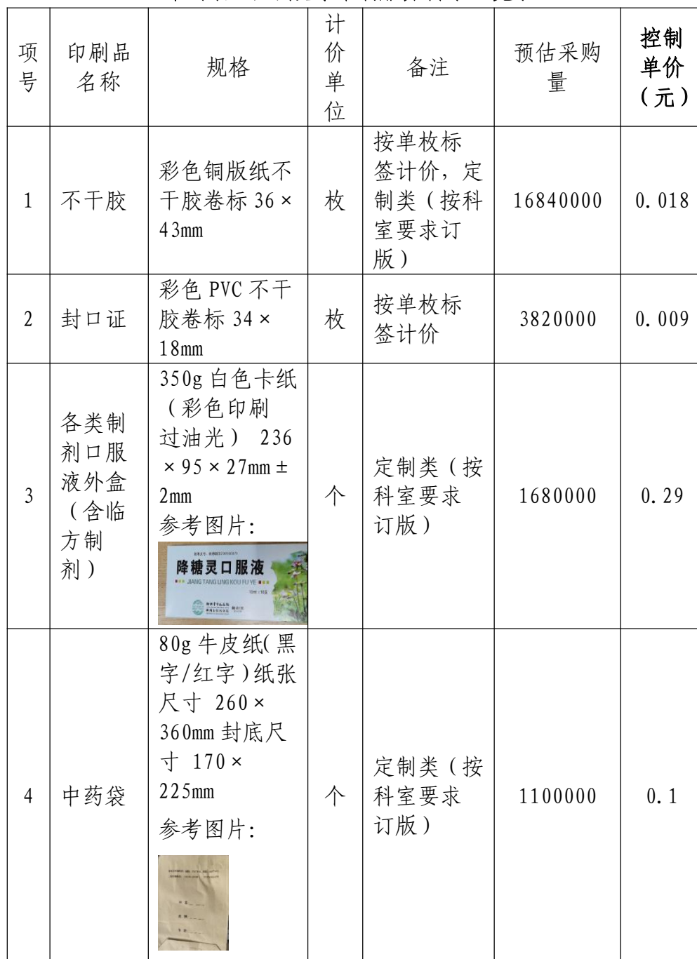
《中药袋 不干胶等印刷服务需求一览表》